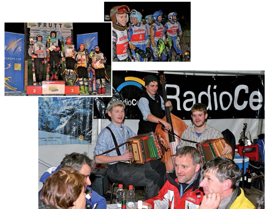
Impressionen Nachtslalom 2009

Die Skipass-Tageskarten sind jeweils auch am Abend gültig!