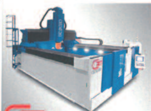
Gantry Type 5-Axis Machining Centers