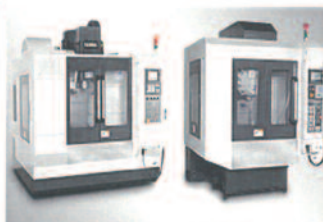
High Performance Machining Centers