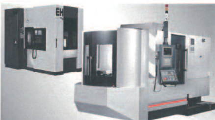
Heavy Duty Horizontal Machining Centers