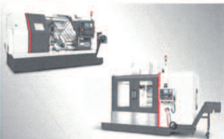
Heavy Duty CNC Solution