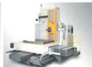
Table Type Horizontal Boring and Milling Machines