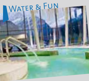
WATER & FUN

Streda del Piz n. 7 - Canazei (TN) - Tel. 0462 601348 / 608811 - info@dolaondes.it - www.dolaondes.it