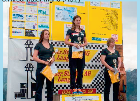
Siegerpodest Riesenslalom 2014