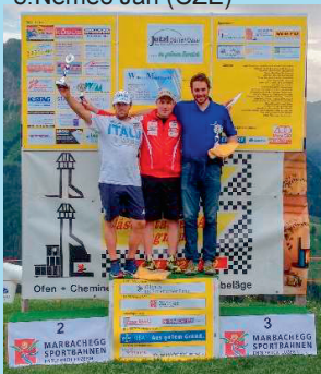
Siegerpodest Super-G 2014