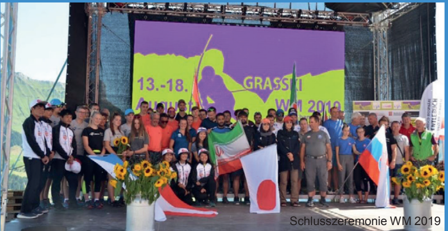
Schlusszeremonie WM 2019